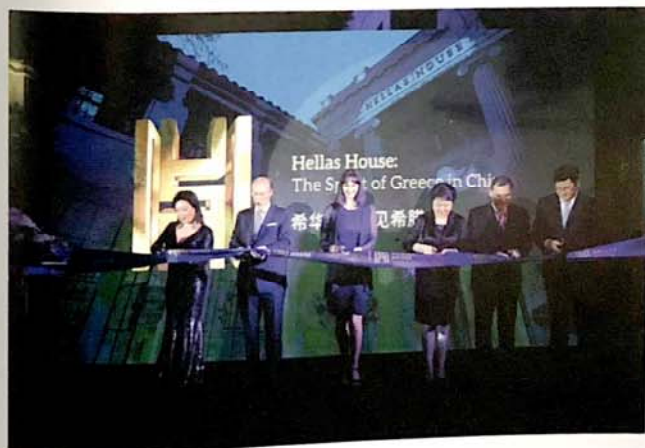
希华馆开幕仪式上，以古希腊的智慧和文化遗产为灵感，引介希腊独特的现代生活方式

据了解，希华馆将定期举办希腊主题产品展览、艺术品和手工艺品展览，希腊历史、学术讲座，希腊建筑学实地讲座、研讨会，希腊语学习角，品酒会、烹饪课以及私人定制商务或个人派对，爱琴海婚宴中心，希腊婚礼策划中心，希腊旅游商务投资咨询等活动。