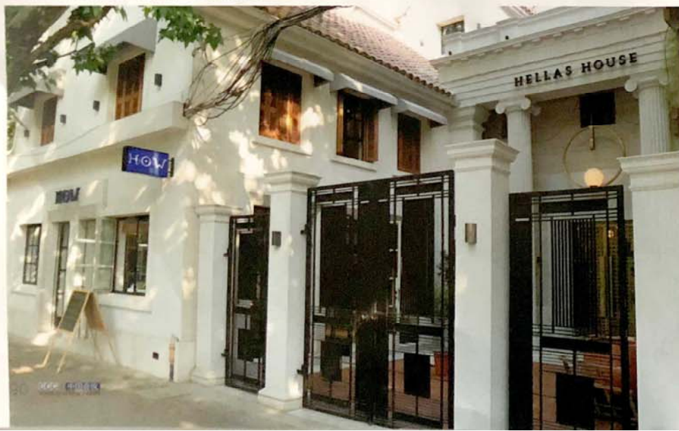
希华馆致力于成为全球领袖俱乐部，打造上海新一代人文地标建筑

汉莎航空： 13:15——02:15 (13h 中转法兰克福) 浦东国际机场T2——圣托里尼机场 回程：9月29日 汉莎航空： 19:20——15:15 (14h55m 中转慕尼黑) 圣托里尼机场——浦东国际机场T2